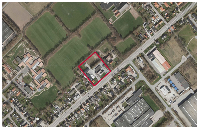
Luftfoto med markering af rammeområde 5C3. Luftfoto forår 2019