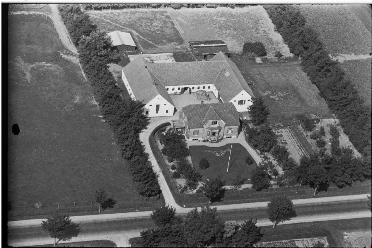
Foto af gården fra 1930'erne, hvor den stadig var rimelig ny. Danmark set fra luften før Google. FotoID: L00217_015