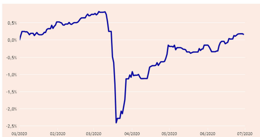
Figur 2: Udvikling i afkast på kommunens obligationsportefølje

Starten på COVID-19-krisen havde en voldsom påvirkning af prisfastsættelsen på samtlige aktiver, herunder også danske renter og obligationer. Som det fremgår af nedenstående figur har renter og kurser normaliseret sig i de efterfølgende måneder.