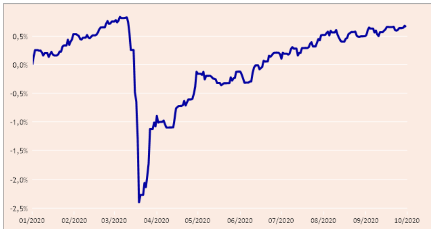
Figur 2: Udvikling i afkast på kommunens obligationsportefølje

Starten på COVID-19-krisen havde en voldsom påvirkning af prisfastsættelsen på samtlige aktiver, herunder også danske renter og obligationer. Som det fremgår af nedenstående figur har renter og kurser normaliseret sig i de efterfølgende måneder.