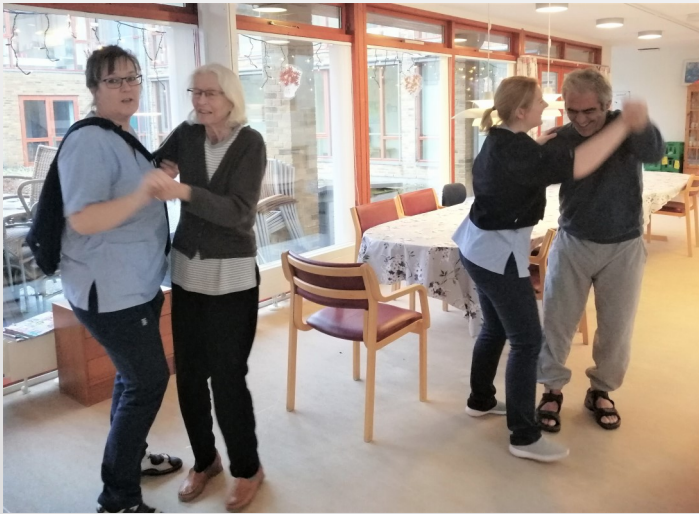
A st. en helt almindelig eftermiddag gik der dans i den i A st.