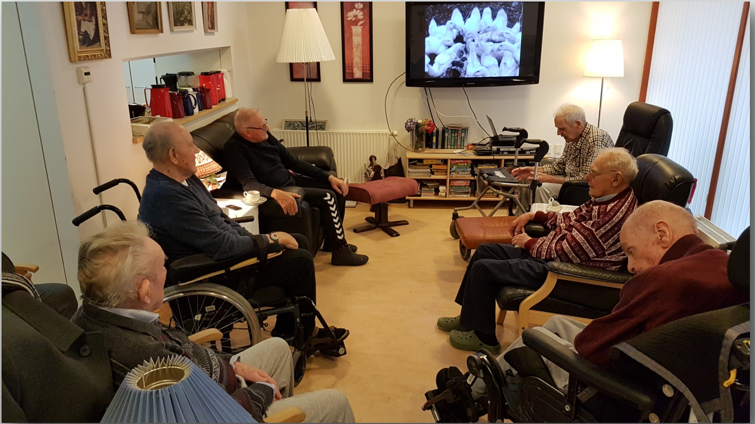
Aktivitet i C st.

Herreløgen har været samlet, og denne gang var emnet landbrug. Flere af deltagerne kunne fortælle gode historier om deres oplevelser i landbruget 12