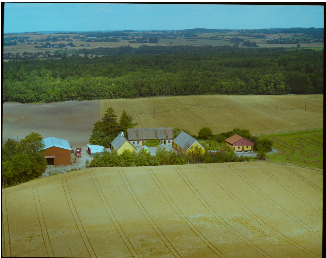
Danmark set fra luften 1986.

De er velkommen til at henvende Dem til museet, hvis De har spørgsmål.