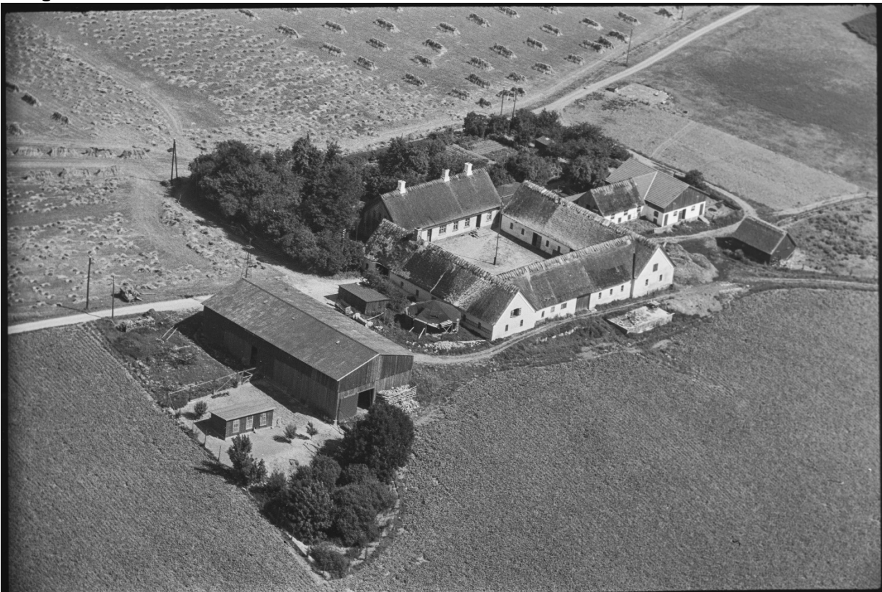
Danmark set fra luften 1939.

Historiske fotos viser udviklingen, hvor den tids- og formentlig egnstypiske gård bid for bid har været udsat for nedrivninger til i dag, hvor kun stuehus, en enkelt lade og mindre udhuse er tilbage.