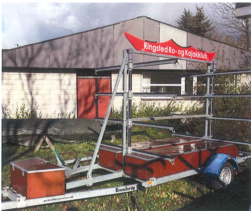
Klubbens nuværende kajaktrailer, behørigt afmærket med "Hjemsted".

Forside > Trailere > Kajaktrailere / kanotrailere