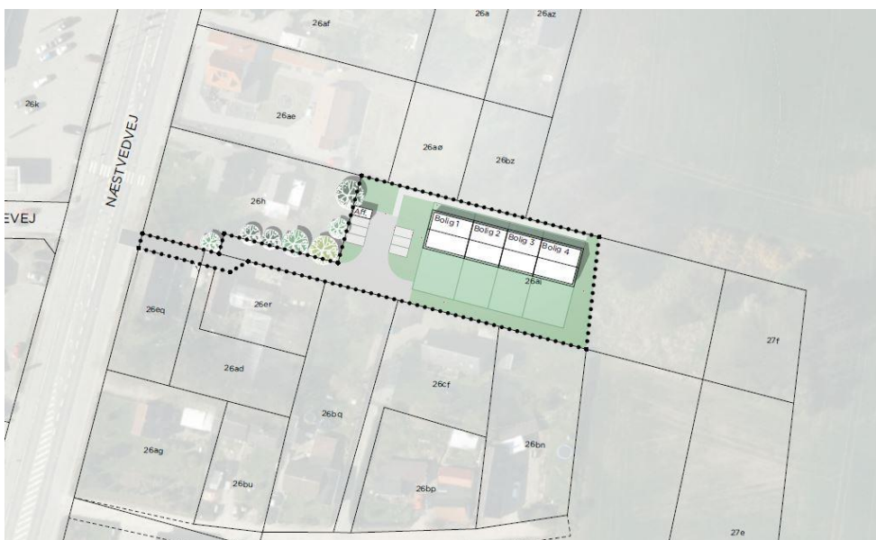
Figur 3: Områdets disponering