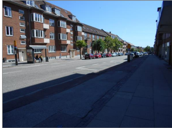
Figur 2: Sjællandsgade set mod hhv. nord og syd