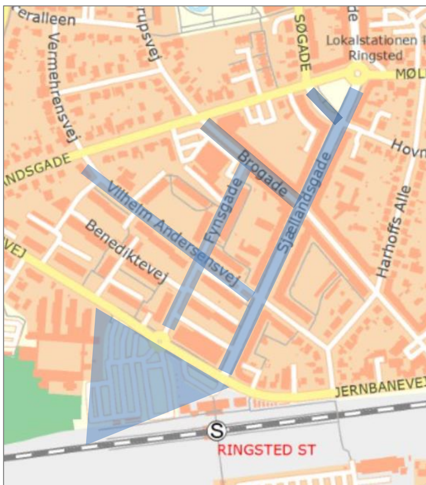
Figur 1: Offentlige parkeringsområder omkring Sjællandsgade (www.kortforsyningen.dk)

Der indgår tællinger af parkerede køretøjer i analysen, og disse tællinger har fundet sted fra d. 4. juni til d. 13. juni 2018.