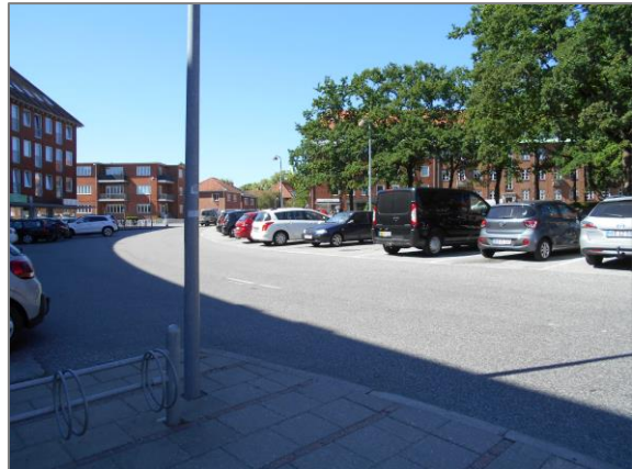
Figur 3: Søgade set mod hhv. øst og vest