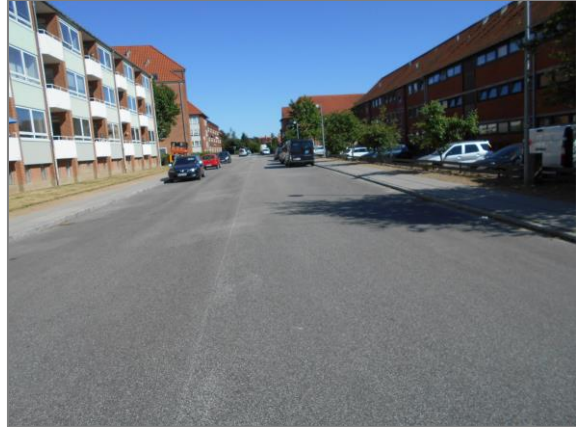
Figur 6: Vilhelm Andersensvej set mod hhv. vest og øst