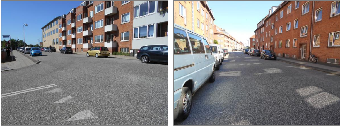
Figur 4: Den vestlige og østlige del af Brogade

Her parkeres langs vejen i begge vejsider. Området udgør etageejendomme med beboelse, og derudover ligger der et supermarked på gaden.