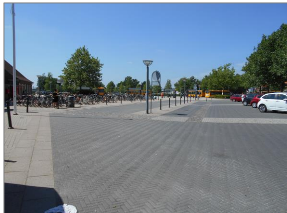
Figur 7: Hhv. langtidsparkering og korttidsparkering ved Ringsted station