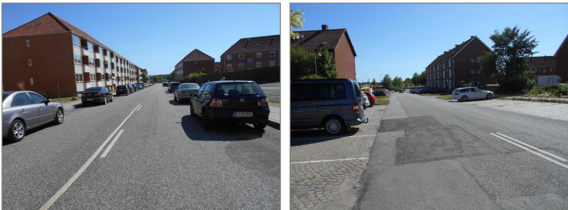
Figur 5: Den nordlige og den sydlige del af Fynsgade

Nord for krydset med Vilhelm Andersensvej holder køretøjer parkeret langs vejsiden i hver side af Fynsgade. Syd for krydset er der afmærkede parkeringspladser med vinkelret parkering i hver vejside. Fynsgade forløber i både den nordlige og den sydlige ende gennem boligområder med etageejendomme.