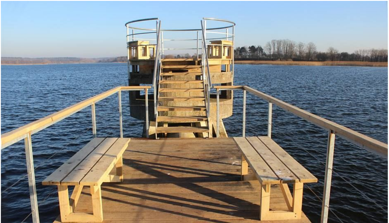
Foto (2): Følgende fugleudkigspunkt er i efteråret 2016 etableret ved Haraldsted sø og dæmningen. Der er således allerede gode muligheder for fuglekiggere i området.