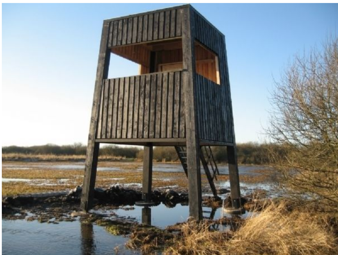
Foto (1). Eksempel på udkigstårn, hvortil der blot kræves et grundareal på ca. 16 kvm.

Endnu et fugletårn - eksempelvis som foto på ca. 16 kvm. (1) - kan sagtens indpasses ved dæmningen uden at dette udelukker etableringen af faciliteter til Ringsted Kajakklub samme sted. Det bemærkes, at der ved dæmningen i efteråret 2016 også er etableret et nyt udkigspunkt til fuglekiggere på det gamle pumperør i søen. Se foto (2).