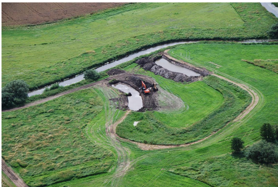
Nye slyng graves ved genslyngning af mellemste Suså.

Den kommunale Natura 2000-handleplan er som udgangspunkt omfattet af krav om miljøvurdering i henhold til lov om miljøvurdering af planer og programmer (lovbekendtgørelse nr. 1533 af 10. december 2015). For samtlige statslige Natura 2000-planer er der foretaget en strategisk miljøvurdering. Handleplanerne har et indhold, der ikke adskiller sig fra de oplysninger, som allerede er givet i de miljøvurderede Natura 2000-planer. Da handleplanen ikke sætter nye rammer for fremtidige anlægstilladelser, eller yderligere vil kunne påvirke internationalt udpegede naturbeskyttelsesområder væsentligt, er det kommunernes vurdering, at der ikke er behov for en fornyet miljøvurdering.