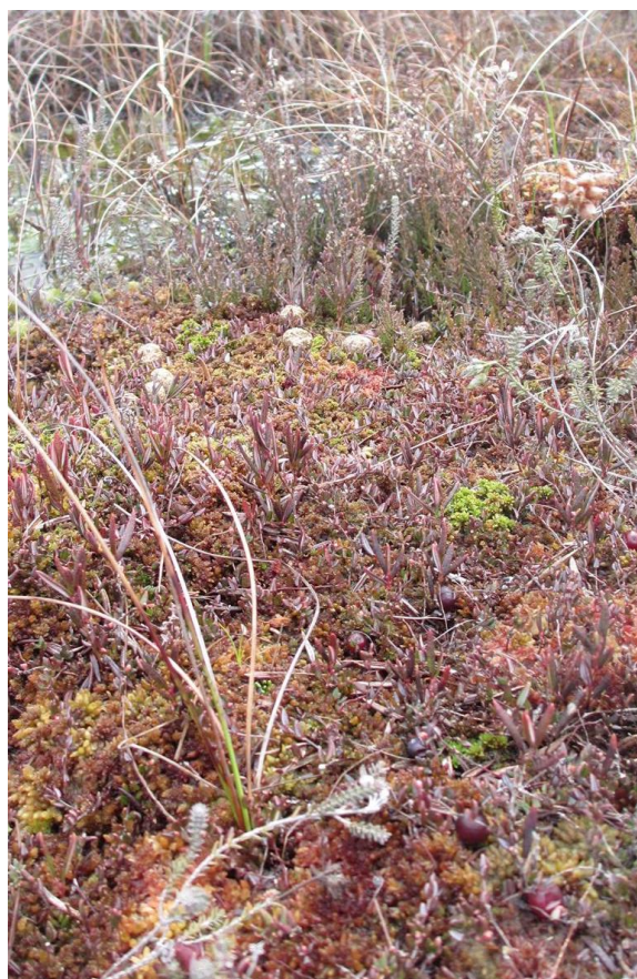
Tue med tranebær, hedelyng, klokkelyng, rosmarinlyng og spagnum i Holmegårds Mose.