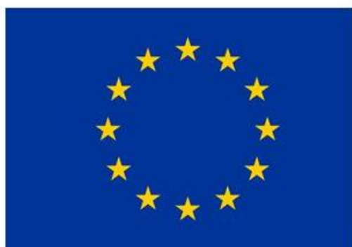
Den Europæiske Union Den Europæiske Hav- og Fiskerifond